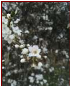
V květu