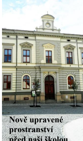
Nově upravené prostranství před naší školou.